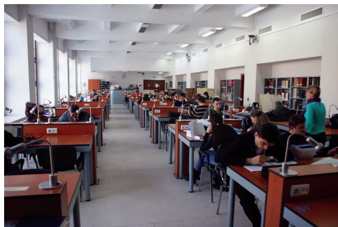
Sala de lectură „Ion Bănuș”.

Acad. Ștefan L. Țițeica, fost vicepreședinte al Academiei Române, definea, în 1935, Biblioteca Academiei ca un „teaur al națiunii” (Berindei, 2016, p. 290). Acum putem să o definim, în termenii folosiți în zilele noastre, și ca o sursă de păstrare, creare și răspândire a elementelor de cunoaștere .