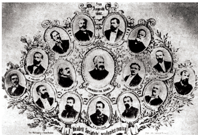
Fondatorii Societății Literare Române.

Textul de față descrie cu precădere cele petrecute în Biblioteca Academiei în ultimele două decenii. În el nu se vor relua elementele conținute în publicațiile evocate mai sus decât în măsura în care ele pot contribui la „pregătirea terenului”, în vederea abordării temei principale abordate aici: contribuția BAR la crearea și păstrarea elementelor de cunoaștere necesare evoluțiilor actuale . Teza pe care dorim să o argumentăm cu descrierea unor fapte este că BAR își îndeplinește în continuare misiunea principală, caracteristică oricărei biblioteci, de a selecta, acumula, întreține și a pune la dispoziția cititorilor elementele de cunoaștere stocate pe diferite medii tradiționale sau mai noi (în special digitale) folosind, într-o măsură tot mai mare, tehnologia informației (TI). În același timp, BAR este și o bibliotecă de cercetare