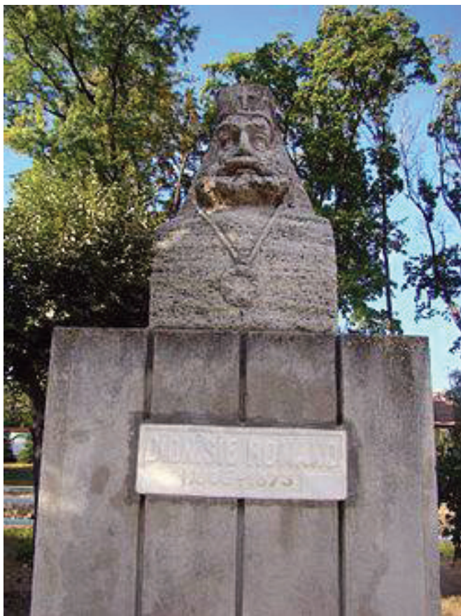
Episcopul Dionisie Romano.

Implicarea, în special în ultima decadă, a Bibliotecii Academiei în proiecte finanțate a permis, în condițiile create de legea amintită, realizarea de acțiuni de modernizare a infrastructurii bibliotecii și stimulare financiară a salariaților care desfășurau activități suplimentare față de cele prevăzute strict de fișa postului. Media ponderii veniturilor proprii s-a ridicat la circa 10% din bugetul instituției, din care aportul proiectelor a fost, în medie de 80%.